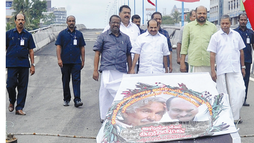
നിർമ്മാണത്തിലെ ക്രമക്കേടുകളെക്കുറിച്ചും അന്വേഷണം വേണമെന്നു സിപിഎം സംസ്ഥാന സെക്രട്ടറി കോടിയേരി ബാലകൃഷ്ണൻ.

കൊച്ചി: യുഡിഎഫിന്റെ കാലത്തു നിർമ്മിച്ച എല്ലാ പാലങ്ങളെക്കുറിച്ചും അന്വേഷണം വേണമെന്നു സിപിഎം സംസ്ഥാന സെക്രട്ടറി കോടിയേരി ബാലകൃഷ്ണൻ. നിർമ്മാണത്തിലെ ക്രമക്കേടുകളെക്കുറിച്ചും അന്വേഷണം വേണമെന്നു സിപിഎം സംസ്ഥാന സെക്രട്ടറി കോടിയേരി ബാലകൃഷ്ണൻ.