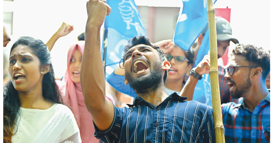
അഭിമുഖ്യം വിന്റെ കൊലയ്ക്കു പിന്നിലെ മുഴുവൻ പ്രതികരണവും പിടി കുടഞ്ഞെന്നു വരുത്തിയ കെഎസ്യു സത്യഗ്രഹത്തിനിടെ പോലീസുമായി വാക്കേറ്റം.